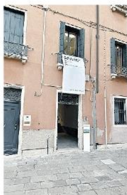
CAMPO SANTO STEFANO La casa che ospita "Spark"

E' la conclusione del suo corso residenziale di tre mesi, ospite del Centro Tedesco di Studi Veneziani.